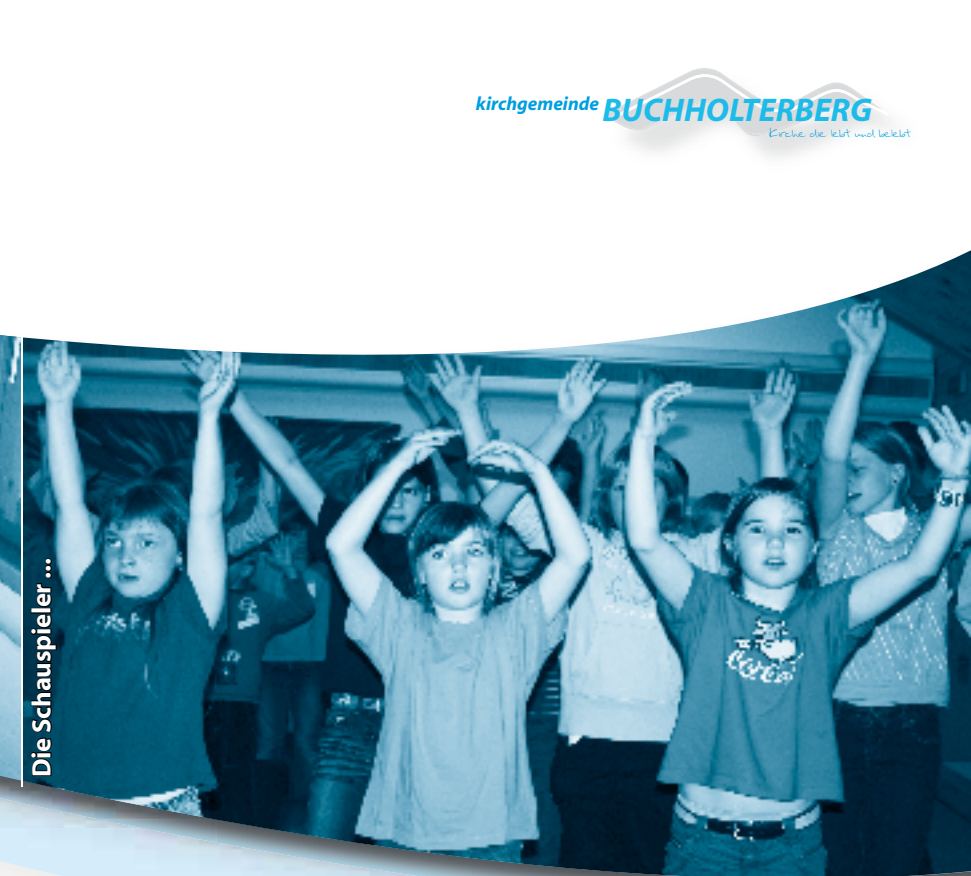
Die Schauspieler ...