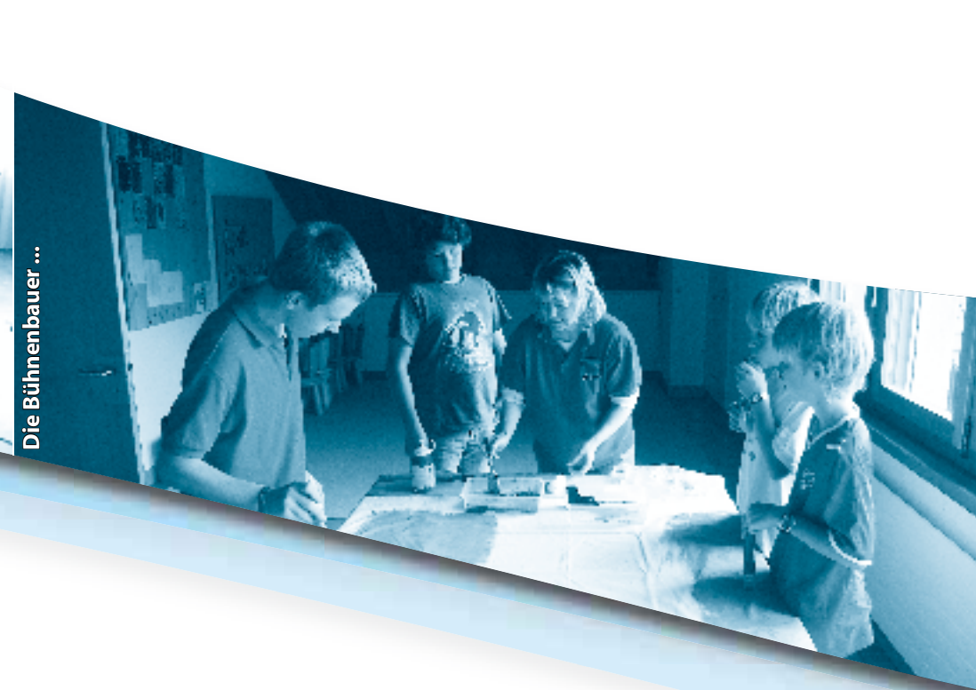
Die Bühnenbauer ...