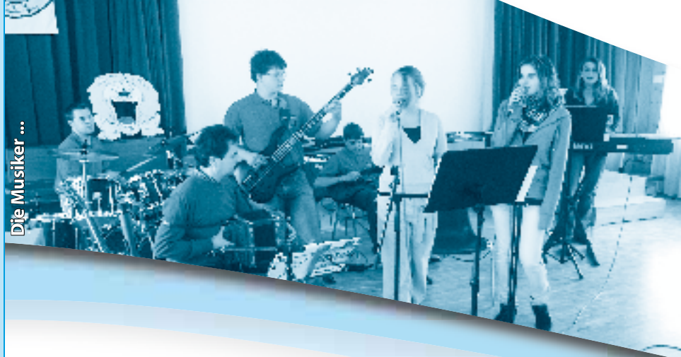
Die Musiker ...

info@kirche-heimenschwand.ch www.kirche-heimenschwand.ch