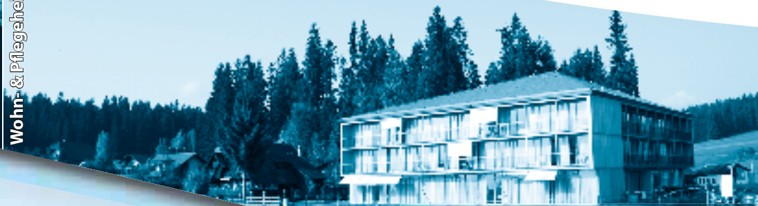
Wohn- & Pflegeheim «Schibistei»

«Alt werden wollen alle – alt sein niemand»